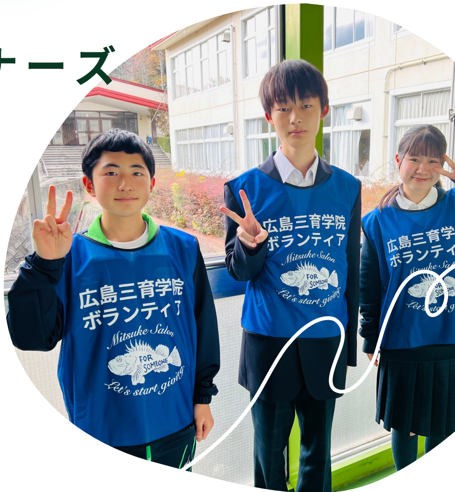
卒業生の寄付により ソアンのビブスが完成しました。

ソアンで「誰かを」支えたい。 その「ソアンを」支えたい。 その思いをソアンパートナーという形で応援してみませんか。